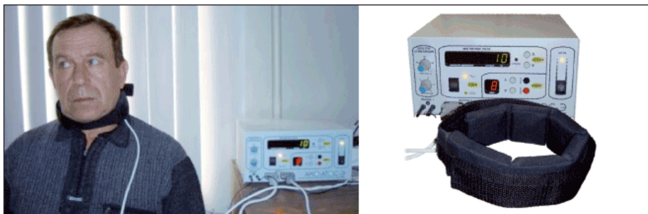
Рис. 2. Проведение магнитотерапии на область шейных симпатических ганглиев на аппарате «АМО–АТОС»