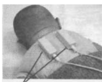
Излучатель БИМП для лечения поражения шейного отдела новорожденных