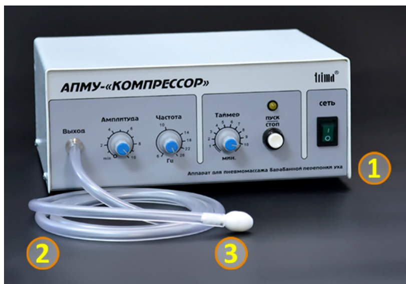
Рис.1. Общий вид аппарата АПМУ-"КОМПРЕССОР".