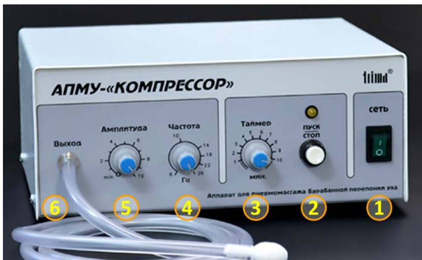
Рис.2. Передняя панель аппарата АПМУ-"КОМПРЕССОР".